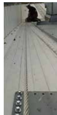
Detail of the installation